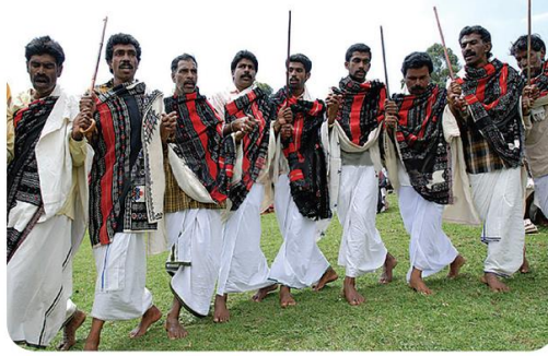
தோடர் பழங்குடியின மக்கள்

ஒரு சமூகத்தின் அடிப்படை அலகு குடும்பம் ஆகும். குடும்பம் என்பது இருவகைப்படும்: அவை கூட்டுக்குடும்பம் மற்றும் தனிக்குடும்பம் ஆகும். பல குடும்பங்கள் சேர்ந்து இணக்கமான சூழலில் வாழ்ந்து கொண்டிருக்கின்றனர். மேலும் பல குடும்பங்கள் இணைந்து கிராமங்களாகவும், பல கிராமங்கள் இணைந்து நகரங்களாகவும் உருவாகின்றன. குடிநீர், உணவு, மின்சாரம், கல்வி, வீட்டுவசதி போன்ற பல தேவைகளே மக்களை ஒன்றுபடுத்தி சமூக நல்லிணக்கத்துடன் வாழச் செய்கின்றன. நமது பண்பாட்டு நடைமுறைகள் அல்லது வாழ்வியல் அமைப்புகள் வேறுபட்டு இருப்பினும் அடிப்படையில் நாம் ஒருவரை ஒருவர் சார்ந்து ஒன்றாக இணைந்து வாழ்ந்து வருகிறோம்.