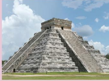
பிரமிடு மயன் நாகரிகம் மத்திய அமெரிக்கா