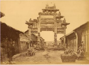
நுழைவாயில் ஹான் அரச வம்சம் – சீனா கி.மு. (பொ.ஆ.மு) 206 – கி.பி. (பொ.ஆ) 220

கி.பி. (பொ.ஆ.) மூன்றாம் நூற்றாண்டின் இறுதியில் சங்ககாலம் படிப்படியாகத் தனது சரிவைச் சந்தித்தது. சங்க காலத்தைத் தொடர்ந்து களப்பிரர்கள் தமிழகத்தைக் கைப்பற்றி இரண்டரை நூற்றாண்டுகள் ஆட்சி செய்தனர். களப்பிரர்களைப் பற்றி அறிய நமக்குக் குறைவான குறிப்புகளே கிடைத்து உள்ளன. அவர்கள் விட்டுச்சென்ற நினைவுச் சின்னங்கள், தொல்கலைப் பொருட்கள் என எதுவுமில்லை. ஆனால் அவர்களின் ஆட்சி குறித்து இலக்கியங்களில் சான்றுகள் உள்ளன. இலக்கியச் சான்றுகள், தமிழ் நாவலர் சரிதை, யாப்பெருங்கலம், பெரியபுராணம் ஆகியவற்றை உள்ளடக்கியதாகும். சீவக சிந்தாமணி, குண்டலகேசி ஆகிய இரண்டும் இக்காலத்தில் எழுதப்பட்டவைகளாகும். தமிழகத்தில் பௌத்தமும், சமணமும் முக்கியத்துவம் பெற்ற காலம் அது. சமஸ்கிருதம், பிராகிருதம் ஆகிய மொழிகளின் அறிமுகத்தால் வட்டெழுத்து என்னும் புதிய எழுத்துமுறை உருவானது. பதினெண் கீழ்க்கணக்கைச் சேர்ந்த பல நூல்கள் இயற்றப்பட்டன. இக்காலத்தில் வணிகமும் வர்த்தமும் தொடர்ந்து செழித்தோங்கின. எனவே களப்பிரர் காலமானது பொதுவாகச் சித்திரிக்கப்பட்டதைப் போன்று இருண்ட காலம் அல்ல.