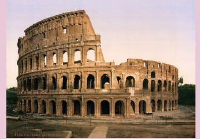
கொலொசியம் ரோமானிய நாகரிகம்–இத்தாலி கி.மு. (பொ.ஆ.மு) மூன்றாம் நூற்றாண்டு முதல் கி.பி. (பொ.ஆ) முதலாம் நூற்றாண்டு வரை